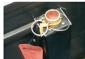
Hệ thống này dập tắt lửa và ngăn lửa cháy trở lại.