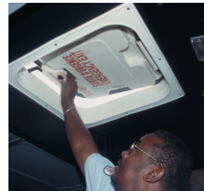
Sử dụng nắp thoát trên trần khi cửa và cửa sổ bị kẹt.