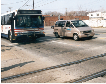
Metrobus ngưng lại tại tất cả cổng xe lửa.

Metrobus chạy trên một khu vực có 23 cổng xe lửa băng qua đường. Trong một tuần đặc biệt, Metrobus chạy ngang qua cổng xe lửa hơn 5,200 lần.