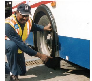
Dụng cụ bánh xe đẩy ra bất cứ vật nào ra ngoài đường đi của xe buýt.

Hình vòng cung của tấm chắn giống như một cái cánh, đẩy ra bất cứ vật nào nằm trên đường đi của xe buýt.