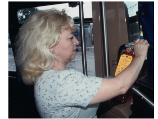
Bình chữa lửa nằm phía trước xe buýt...