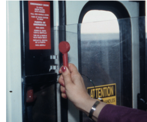
... đập bể kiếng và dùng chốt mở cửa bằng tay.