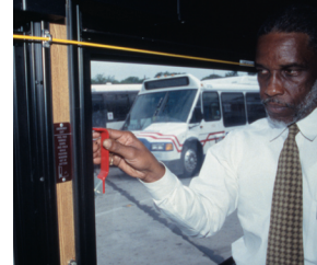
Sử dụng búa nhỏ màu đỏ...

Xe buýt chạy bằng hơi khí thiên nhiên ép có trang bị một hệ thống dập tắt lửa bảo vệ máy khỏi bị cháy. Trường hợp có hỏa hoạn, hệ thống này dập tắt lửa và ngăn lửa cháy trở lại.