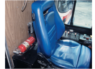
... thường phía sau ghế ngồi của tài xế.