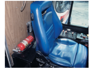
...일반적으로 운전석 뒤에 있습니다.