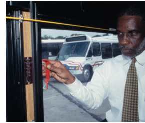
빨간색 망치를 사용하여...

압축 천연가스 버스에는 엔진 화재를 예방하는 화재진압장치가 장착되어 있습니다. 화재가 발생하면 이 장치가 화재를 진압하고 재발을 방지합니다.