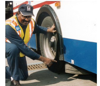
보호용 바퀴 장치는 걸리는 모든 물체를 버스 주행선 밖으로 밀어냅니다.

메트로버스에는 보호용 바퀴 장치(장치)가 장착되는데, 이 장치는 버스 뒷바퀴 아래로 사람이 쓰러질 경우 사람을 밀어내어 위험으로부터 보호합니다. 이 보호장치는 우측 뒷바퀴에 부착됩니다. 곡선 모양의 이 장치는 날개와 같은 역할을 함으로써 걸리는 모든 물체를 들어올려 버스 주행선 밖으로 밀어냅니다.