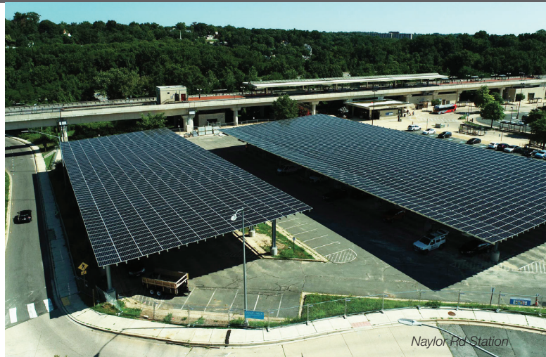
Naylor Rd Station