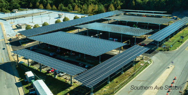
Southern Ave Station