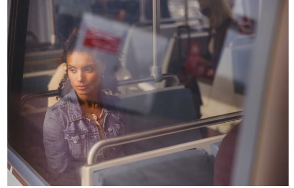
صورة لراكب يجلس في القطار